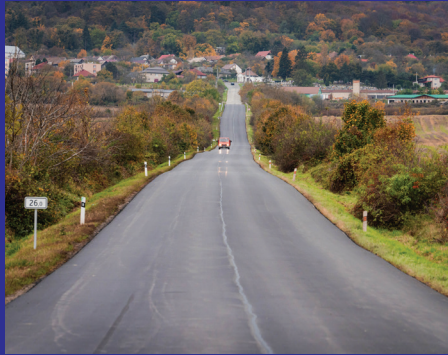
Slanec - Slanské Nové Mesto