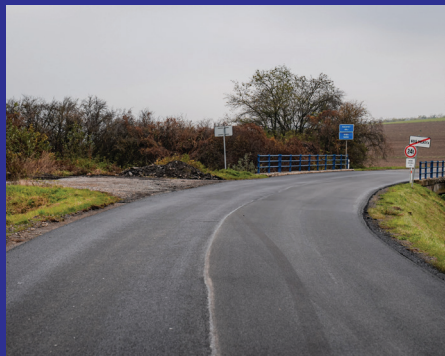
Nová Polhora - hranica okresov PO a KE kraja