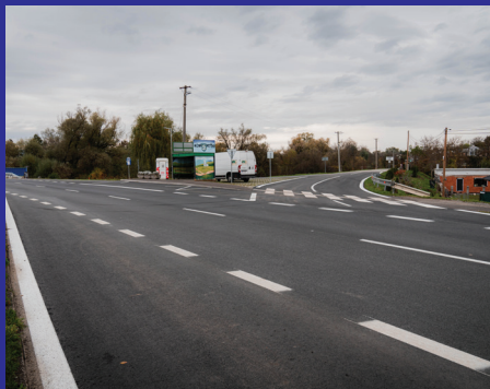
Nižná Hutka smer odbočka Nižná Myšľa