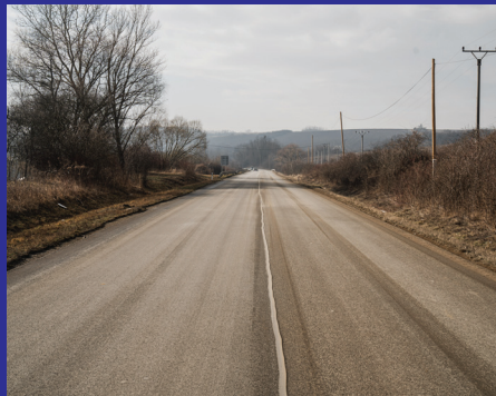
Odbočka Vyšná Myšľa - odbočka Nižný Čaj